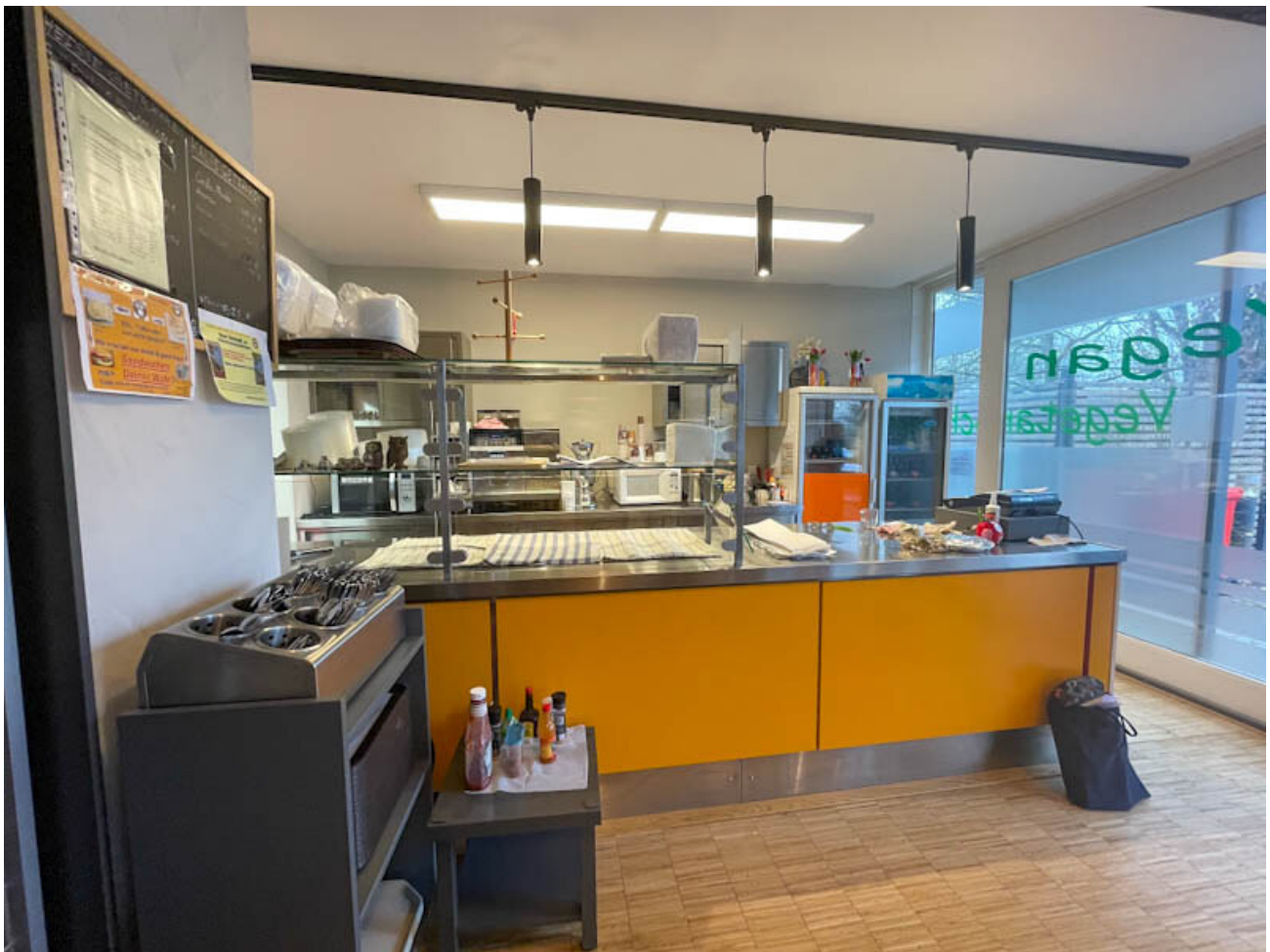
Theke des Philo Cafés