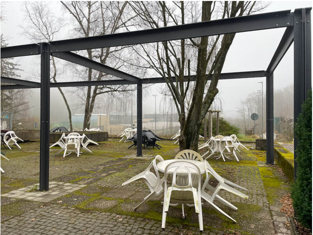
Außenansicht der Terrasse des Philo Cafés