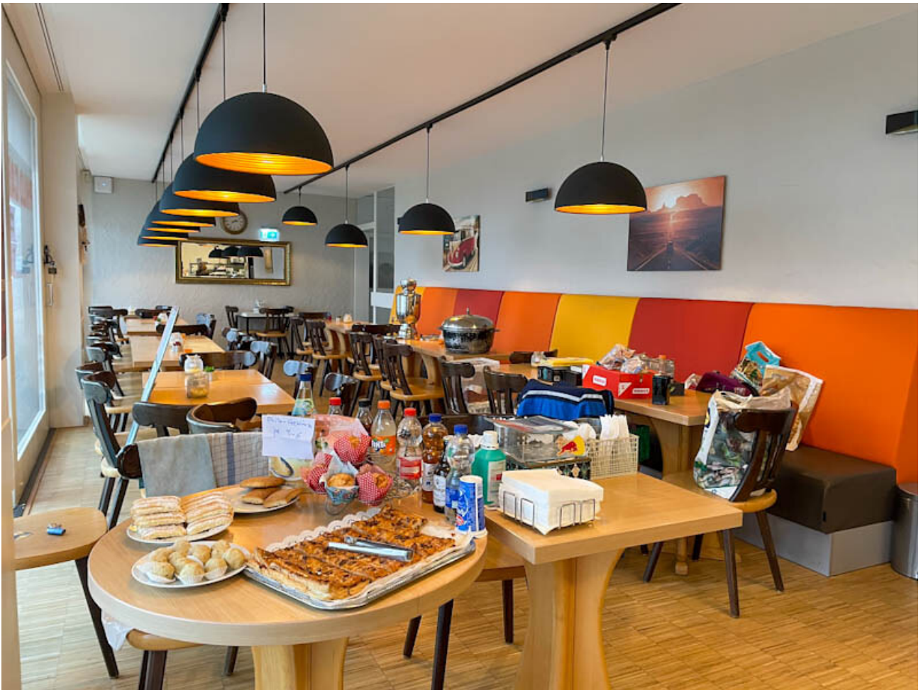
Innenansicht des Philo Cafés