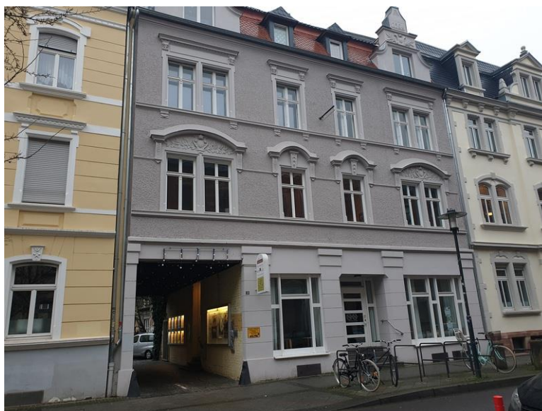
Image 1: Aide au Sida de la Sarre, extérieur, photo prise de gauche à droite

Il s'agit d'une campagne de prévention pour les hommes gays et autres, ainsi que pour les personnes intersexes et trans qui ont des relations sexuelles avec des hommes. Des informations complètes sur le VIH et les autres IST y sont proposées.