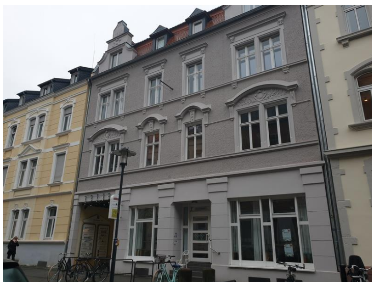
Image 2: Aide au Sida de la Sarre, extérieur, photo prise de droite à gauche