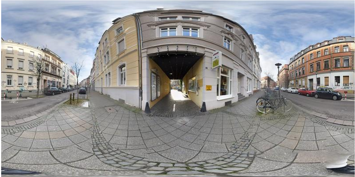
Abbildung 6: 360° Bild des Außenbereichs