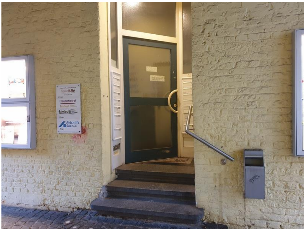
Abbildung 3: Aidshilfe Saar, Eingang