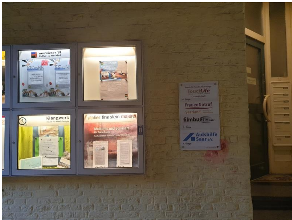
Abbildung 5: Infokasten und Eingang