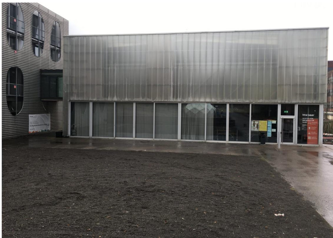
Le bâtiment de la cantine vue de devant

Dans l'ambiance moderne du réfectoire du campus de Göttelborn, un menu végétarien et un menu complet sont proposés aux clients tous les jours du lundi au vendredi.