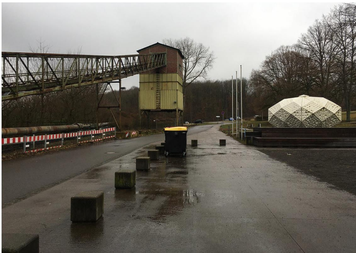
vue sur le campus et les environs depuis la cantine