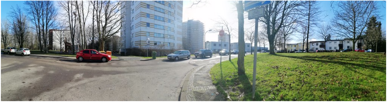
Straßenansicht Tilsiter Straße 1