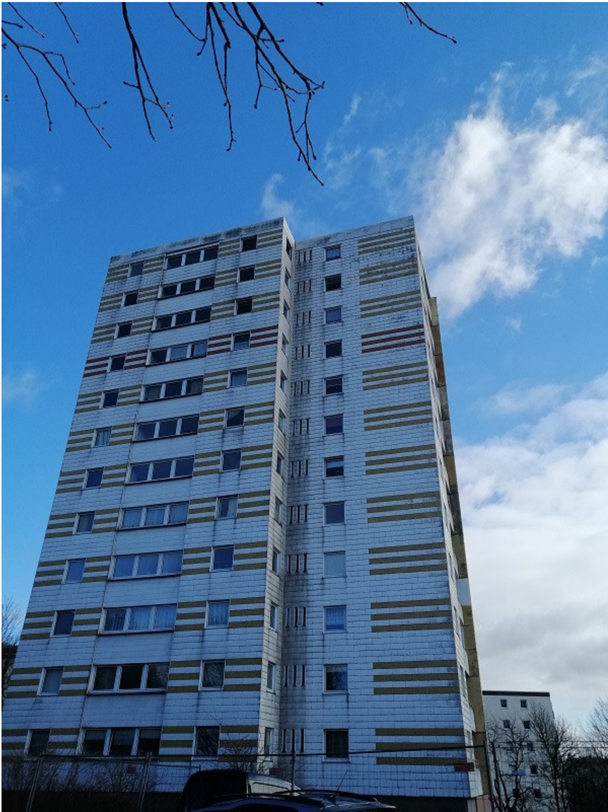
Seitenansicht der Wohnsiedlung