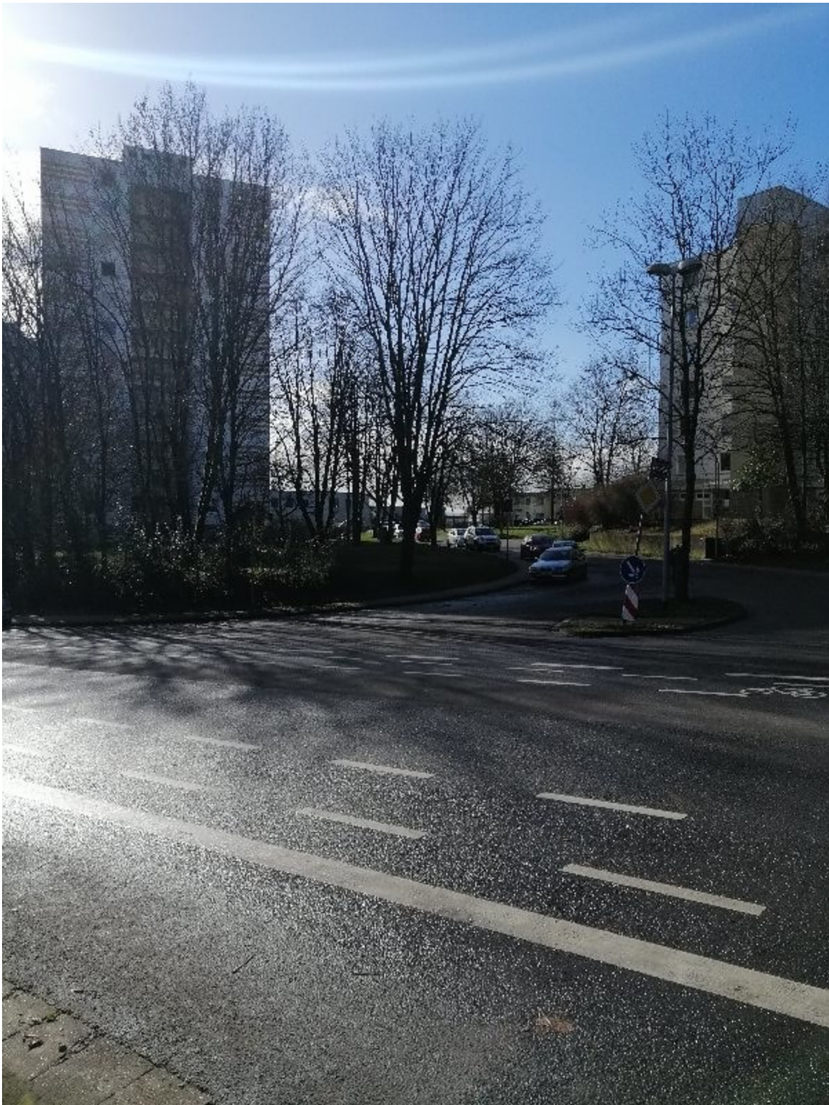
Sicht von der Hauptstraße mit Parkmöglichkeiten