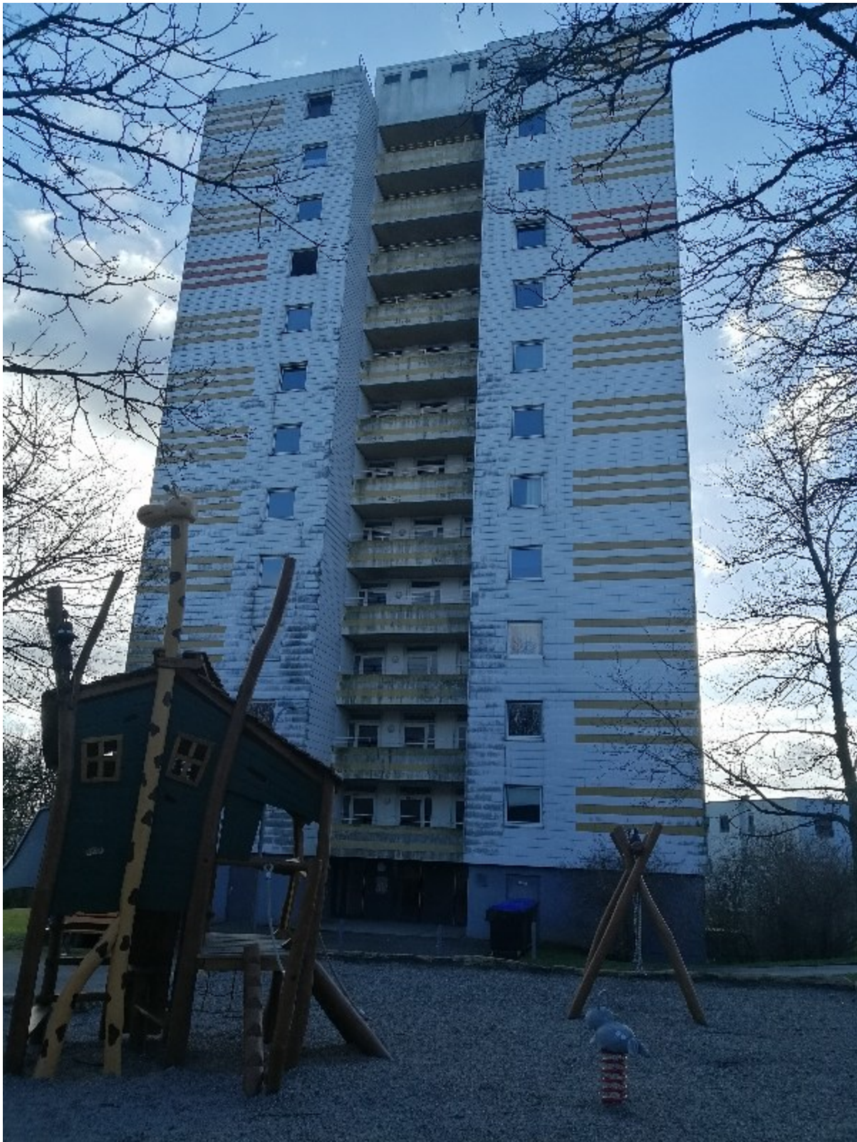
Vorderansicht mit Eingang